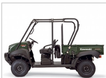
Habitáculo para dos